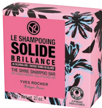
Ragyogó szépség szilárd sampon YVES ROCHER: 1 890 Ft