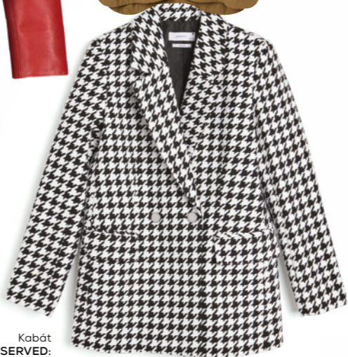
Kabát RESERVED: 19 995 Ft

Ősszel az időjárás kiszámíthatatlan, így még a melegebb napokon is érdemes magunkkal vinnünk az alkalomhoz megfelelő kabátot. A barna kabát megunhatatlan, minden stílushoz tökéletesen passzol, akár az irodába igyekszik, akár a gyerekekkel megy ebédelni. A 4_skandinavia bézs darabja praktikus és időtálló, a csajos forralt borozásokhoz pedig egy vagány, piros Gerry Weber kiskabát az igazi.