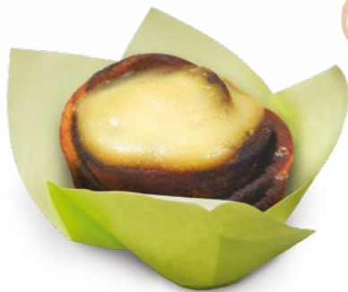
Zero fahéjas rózsza NORBI UPDATE

Amikor odakint esik, fúj, és hideg van, nincs is jobb, mint odabent feltekerni a fűtést, betenni a kedvenc sorozatunkat, kényelmesen elhelyezkedni a kanapén és kibontani a Bortársaságtól egy csomag csípős paprikával és sóval ízesített desszertet, a Szamos Marcipántól egy étcsokoládéval, karamellel vagy fahéjjal bevont pörkölt mandulát. Ha pedig az alakunkra is figyelni akarunk, akkor a Norbi Update fahéjas rózsája biztosan jó választás lesz.