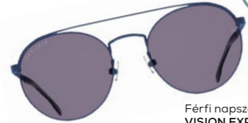
Férfi napszemüveg VISION EXPRESS: 34 990 Ft