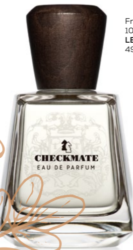
Frapin - Checkmate, 100 ml LE PARFUM: 49 000 Ft