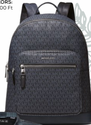
Lifaloft Air Insulated Flannel Shirt dzseki HELLY HANSEN: 59 990 Ft