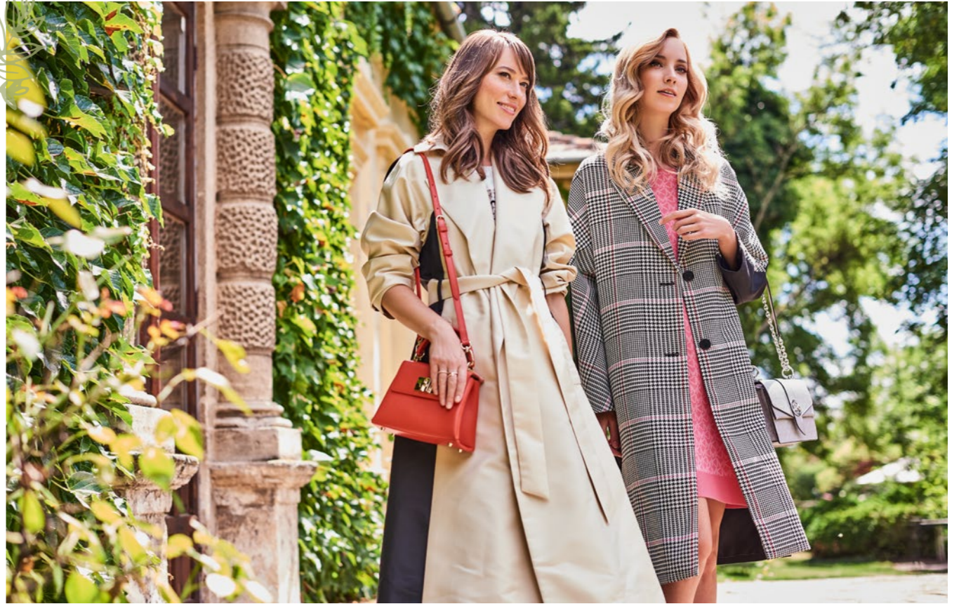
Bal oldali modell: Kabát – NUBU: 149 500 Ft / Póló – GERRY WEBER: 18 995 Ft / Táska – FURLA: 138 500 Ft / Gyűrűk – PANDORA: 28 900 Ft, 11 500 Ft Jobb oldali modell: Kabát – KARL LAGERFELD: 191 990 Ft / Ruha – MICHAEL KORS: 69 000 Ft / Táska – MICHAEL KORS: 104 000 Ft