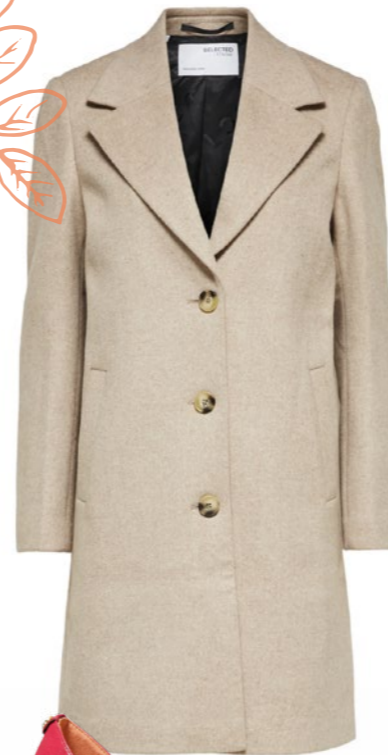
Gyapjú kabát 4_SKANDINAVIA: 61 990 Ft