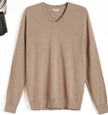
Organikus pamut pulóver RESERVED: 6 995 Ft