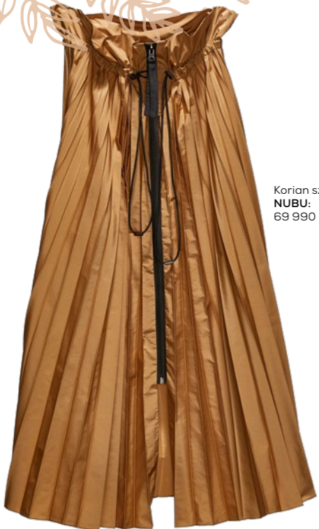
Korian szoknya NUBU: 69 990 Ft

Nem volt könnyű kiválasztani az őszi favoritjainkat, annyi különleges és stílusos darabbal találkozunk nap mint nap az üzleteinkben. De megpróbáltuk a lehetetlent, mutatjuk a jelölteket. A Liu Jo kínálatában biztosan megtalálja a személyiségéhez leginkább illő darabot, amivel még tökéletesebb lehet az őszi szezon. A Silver Island üzletéből választott elegáns óra, a Pandora legújabb kollekcója és a tökéletes NUBU szoknya is mind-mind emlékezetesebbé teszik a rozsdabarna fák alatt tett sétát.