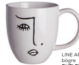
LINE ART bögre BUTLERS: 2 490 Ft