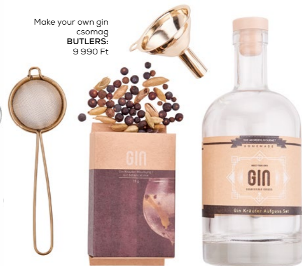
Make your own gin csomag BUTLERS: 9 990 Ft

Amikor kicsit hűvösebb lesz a levegő, ösztönösen az olyan italokhoz és ételekhez vonzódunk, amelyek felmelegítenek vagy karakteresebb ízvilággal rendelkeznek. Ilyen például a Nektária mangó gourmet gyümölcspüré szörpje a SPAR -ból, a BUTLERS Make your own gin szettje, ami elengedhetetlen a borókabogyó szerelmeseinek vagy a Nespresso kávéfőzője , amivel garantáltan elindíthatja a napot.