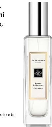
Jo Malone Poppy & Barley Cologne – Cologne. 30 ml DOUGLAS: 21 790 Ft