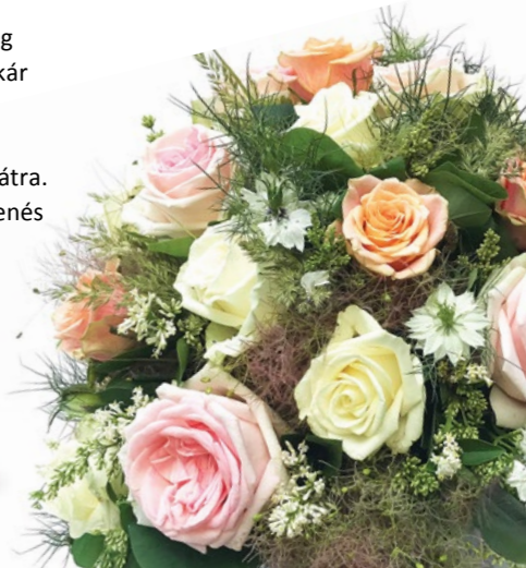
Virágcsokor ARIOSO: 15 500 Ft-tól

A bekuckozás a lecsendesedés, a nyugalom, a boldogság és a béke pillanata, amit a családdal, barátokkal vagy akár egyedül élhet meg. Süssön gesztenyét, gyűjtsön Arioso illatgyertyákat, tegyen minden szobába virágcsokrot, bújjon egy kényelmes Intimissimi köntösbe és dőljön hátra. A BUTLERS -ben és a Tchibo üzletében megtalálja a pihenés minden további kellékét.