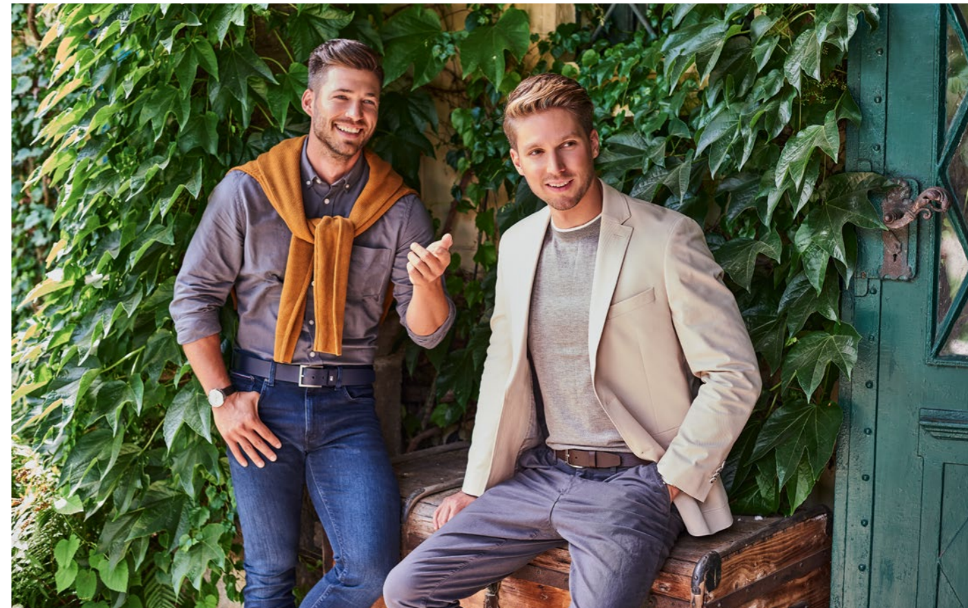
Bal oldali modell: Ing – H&M: 5 995 Ft / Pulóver – 4_SKANDINAVIA: 17 990 Ft / Öv – GRIFF COLLECTION: 15 210 Ft / Farmer – GRIFF COLLECTION: 36 810 Ft / Cluse men's óra – SILVER ISLAND: 79 900 Ft Jobb oldali modell: Zakó – GRIFF COLLECTION: 74 900 Ft / Póló – 4_SKANDINAVIA: 13 990 Ft / Öv – H&M: 4 495 Ft / Nadrág – RESERVED: 9 995 Ft