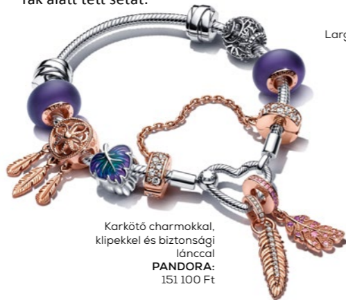
Karkötő charmokkal, klipekkel és biztonsági láncsal PANDORA: 151 100 Ft