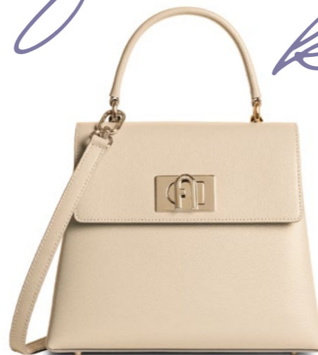
1927 Top Handle S FURLA: 146 500 Ft