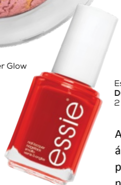
trend IT UP Super Glow arcpirosító DM: 1 199 Ft

A hulló falevelek magukkal hozzák a telt, meleg színeket, árnyalatokat, amik a sminkpalettákon is visszaköszönnek, mint például ebben az elegáns Douglas darabban, amivel rengeteg nappali és esti sminket készíthetünk. Ha pedig csak valami feltűnőre vágyik a hűvösben, dobja fel a Bobbi Brown rúzsát.