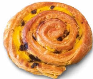
Vaníliás csiga csokidarabokkal NORBI UPDATE