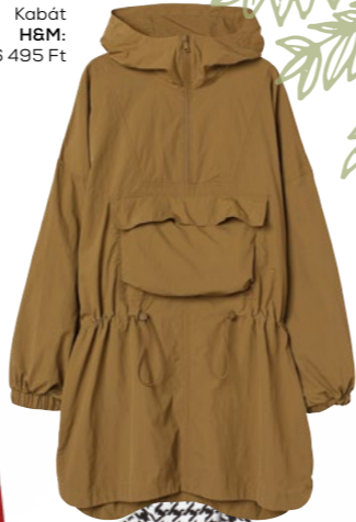
Bőrdzseki GERRY WEBER: 133 995 Ft