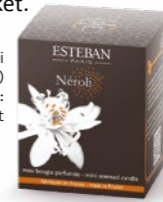
Esteban Paris - Nérolí illatgyertya (70g) ARIOSO: 4 700 Ft