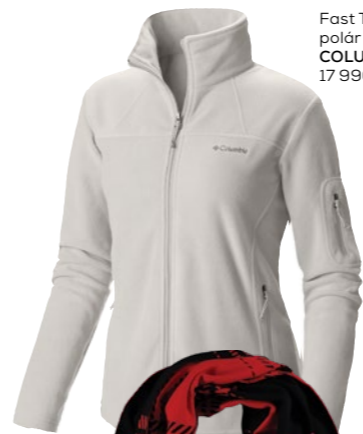
Fast Trek II Jacket polár felső COLUMBIA: 17 990 Ft

Női modell: Garbó – MOHITO: 3 995 Ft / Pulóver – GANT: 53 990 Ft / Short – GRIFF COLLECTION: 27 900 Ft / Cipő – OFFICE SHOES: 20 790 Ft Férfi modell: Póló – COLUMBIA: 15 990 Ft / Pulóver – GRIFF COLLECTION: 50 900 Ft / Nadrág – HELLY HANSEN: 29 990 Ft / Cipő – OFFICE SHOES: 25 990 Ft