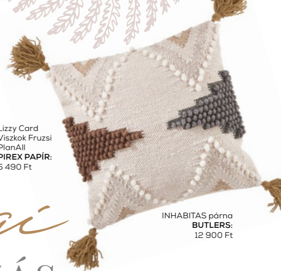
INHABITAS párna BUTLERS: 12 900 Ft