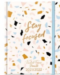
Lizzy Card Viszkok Fruzszi PlanAll PIREX PAPIR: 5 490 Ft