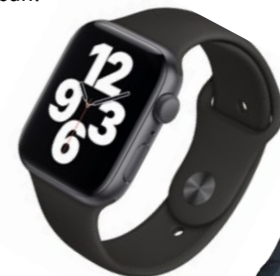
Apple Watch SE GPS 44mm iCENTRE: 119 990 Ft

Válasszon egy egyedi Karl Lagerfeld övtáskát, húzzon fel egy stílusos Helly Hansen gumicsizmát vagy egy Columbia bakancsot és fedezze fel Magyarország nemzeti parkjait. Inkább várost nézne? Pakoljon üdítőt egy gyönyörű Michael Kors hátitáskába, kösse a derekára a Columbia felsőjét, számolja a lépéseit egy iCentre -ben választott okosórán és élvezze az őszt a szabadban!