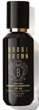
Intensive Skin Serum Foundation SPF40 BOBBI BROWN: 22 200 Ft