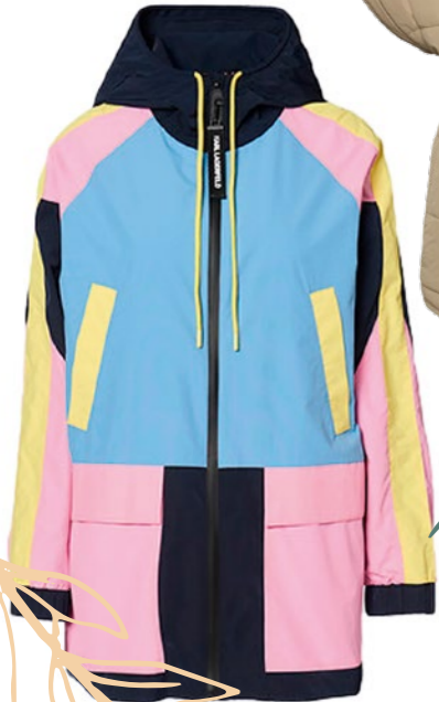
Kabát H&M: 6 495 Ft