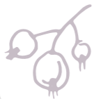
Desert Nudes Szemhéjpuder paletta DOUGLAS: 7 290 Ft