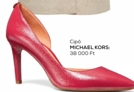
Cipő MICHAEL KORS: 38 000 Ft