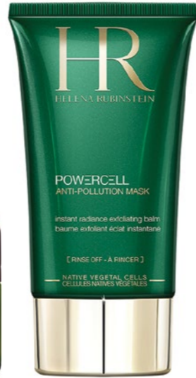
Helena Rubinstein Powercell Anti-Pollution Mask DOUGLAS: 36 990 Ft