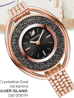
Swarovski Crystalline Oval női karóra SILVER ISLAND: 132 000 Ft