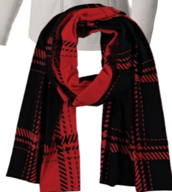
Sál GERRY WEBER: 22 995 Ft