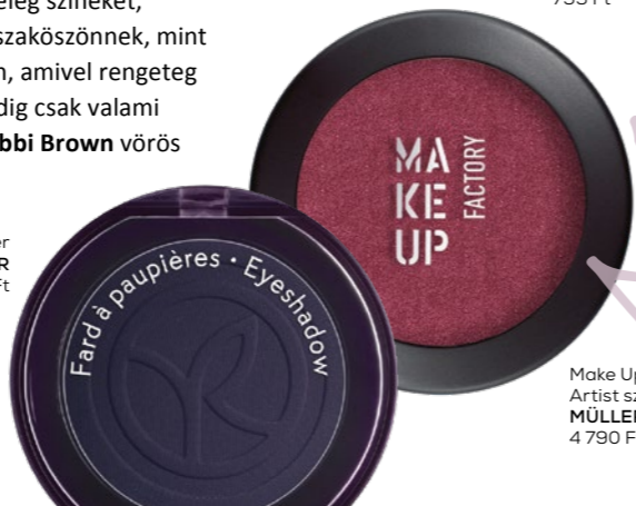
Make Up Factory Artist szemhéjpuder MÜLLER: 4 790 Ft