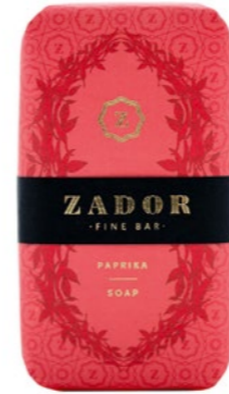
Zador szappan ARIOSO 3 200 Ft