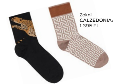
Zokni CALZEDONIA: 1 395 Ft