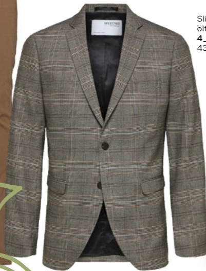
MVMT POWERLANE PYTHON férfi karóra SILVER ISLAND: 59 900 Ft