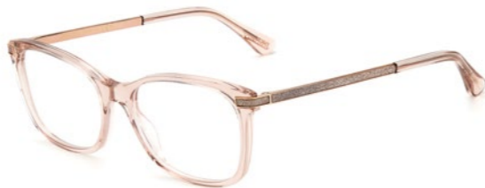
Jimmy Choo szemüvegkeret OPTIC WORLD: 95 990 Ft