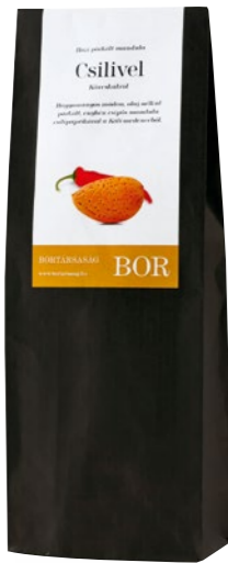
Mandula chilis BORTÁRSASÁG: 1 950 Ft