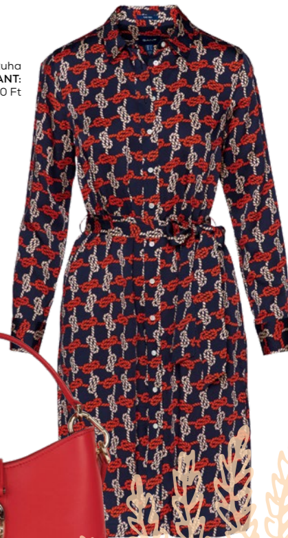
Sirena Hobo Mini FURLA: 115 000 Ft