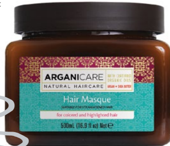
Arganicare hajmaszk DOUGLAS: 6 100 Ft