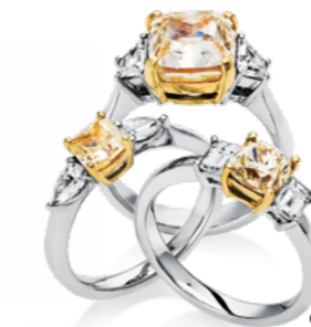
Gyűrűk LUKÁCS ÉKSZER: 269 000 Ft-tól