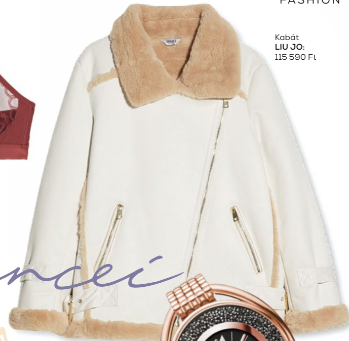
Kabát LIU JO: 115 590 Ft