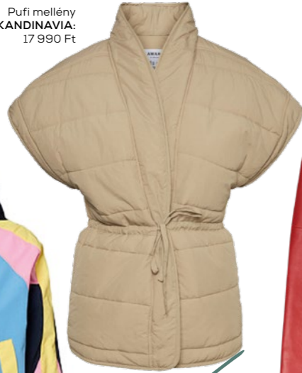
Dzseki KARL LAGERFELD: 154 990 Ft