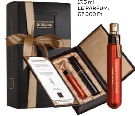
Puredistance - Sheiduna 17,5 ml LE PARFUM: 67 000 Ft