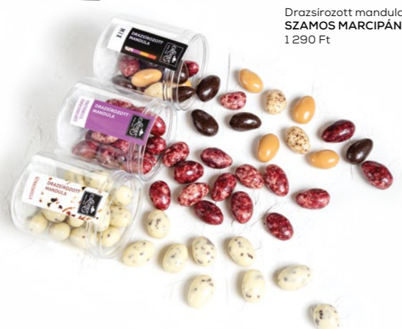
Drazsírozott mandula SZAMOS MARCIPÁN: 1 290 Ft