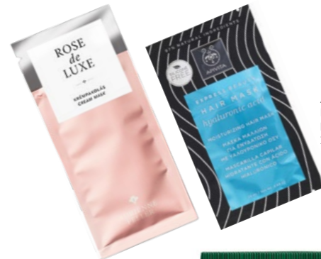
Apivita Express Hidratáló Hajmaszk EVITAL: 1 790 Ft