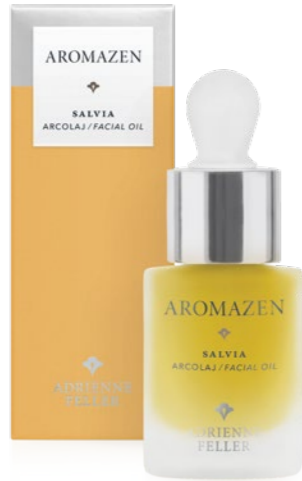
Aromazen Salvia arcolaj ADRIENNE FELLER: 14 224 Ft