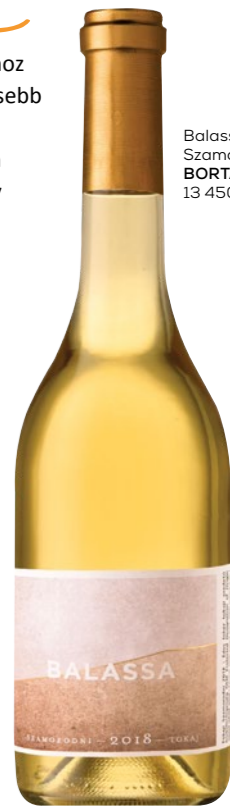
Balassa Szamorodni 2018 BORTÁRSASÁG: 13 450 Ft