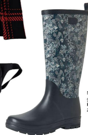
Madeleine Print gumicsizma HELLY HANSEN: 26 990 Ft