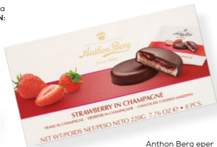
Anthon Berg eper pezsgőben, 220 g SPAR