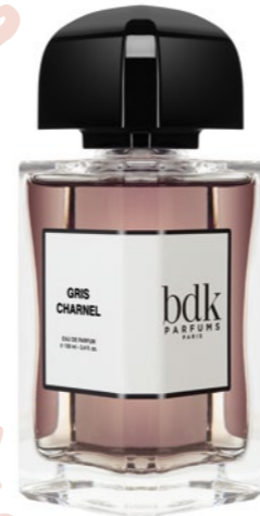
Gris Charnel LE PARFUM: 60 000 Ft