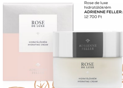
Rose de Luxe hidratálókrém ADRIENNE FELLER: 12 700 Ft