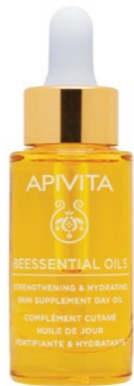
Apivita Beessential Nappali Olaj EVITAL: 9 945 Ft

A fürdőszoba polca igazi kincseket rejt majd, ha kipróbálja az Adrienne Feller Rose de Luxe táplálókrémét, ami harmonizálja, feszesíti, élénkíti az arcbőrt. Férfiaknak kötelező a Barber Shop Uppercut - Matt Pomade hajformázójának a beszerzése, a nőknek egy Apivita nappali olaj lesz az új kedvencük az Evitalól , de a Le Parfum parfümériában is igazi drágasokra bukkanhat.