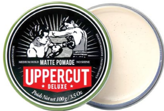
Uppercut - Matt Pomade BARBER SHOP: 6 890 Ft