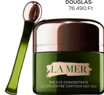
La Mer The Eye Concentrate – Börápoló. 15 ml DOUGLAS: 76 490 Ft