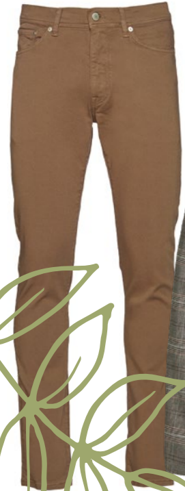
Farmer GANT: 57 990 Ft

A sportosan elegáns stílus igényes, kényelmes darabokból állítható össze és szinte minden alkalomhoz tökéletes. Munkabédre vagy akár randevúra igyekszik egy 4_skandinavia zakót bármikor felkaphat egy farmerral vagy egy barna GANT nadrággal, inggel, és egy Bugatti cipővel a Griff Collection ből.