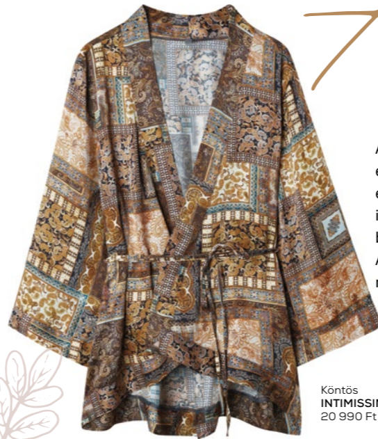
Köntös INTIMISSIMI: 20 990 Ft